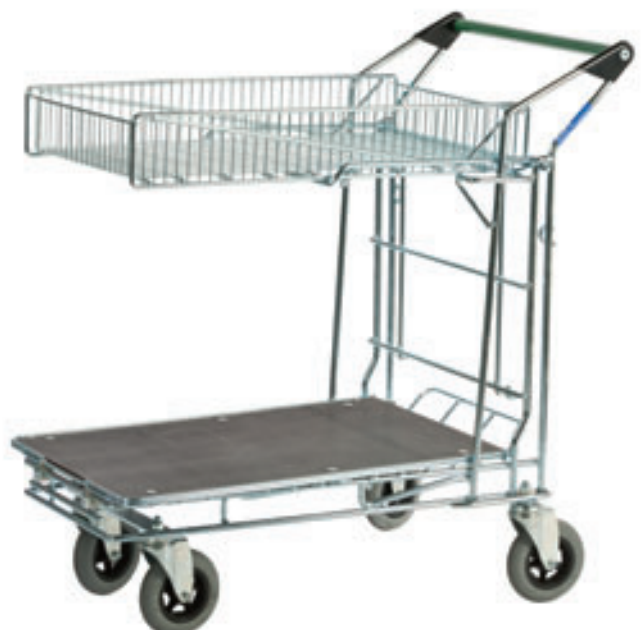
Art.-Nr. 505 H – Holzboden