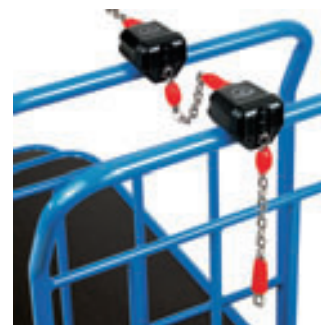
Pfandschloss Art.-Nr. 2910

DIN A4 (längs oder quer) Holz mit Papierklammer und Bleistiftablage