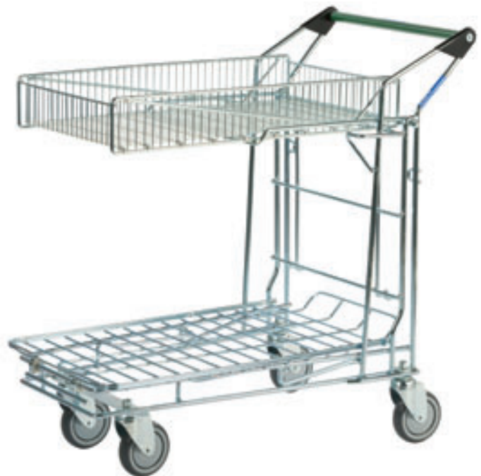
Art.-Nr. 505 G

Bereifung: \varnothing 125 mm Plattform (L x B): 770 x 450 mm Korb (L x B x H): 750 x 450 x 120 mm