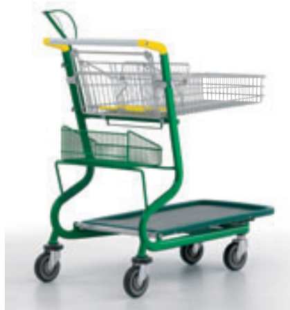
farbig lackiert, Kunststoffplattform