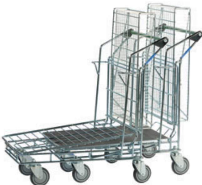
Art.-Nr. 505 – ineinander geschoben