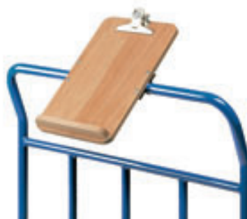
Schreibtafel Art.-Nr. 1290

600 x 140 x 200 mm (L x B x H) aluminium, pulverbeschichtet