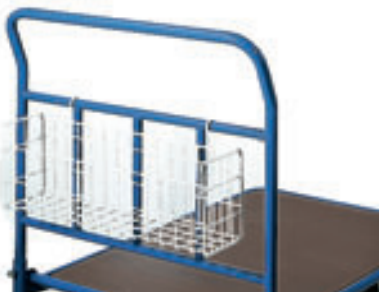
Drahtkorb Art.-Nr. 1291

600 x 140 x 200 mm (L x B x H) aluminium, pulverbeschichtet